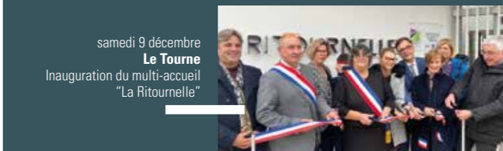
samedi 9 décembre Le Tourne Inauguration du multi-accueil "La Ritournelle"