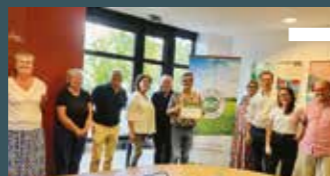
mercredi 13 septembre Latresne Remise label "Territoire bio engagé"