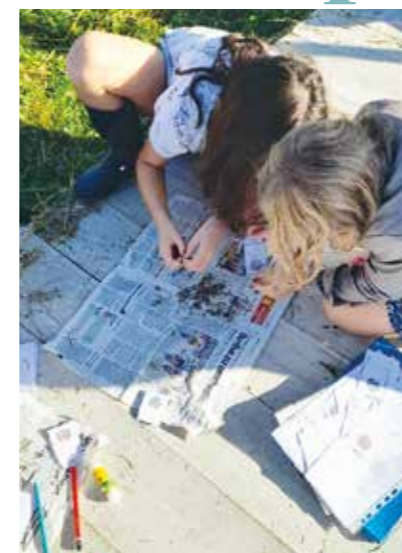
Activités manuelles à l'accueil périscolaire.