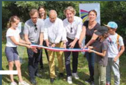
mercredi 5 juillet Camblanes et Meynac Inauguration des chemins de randonnées