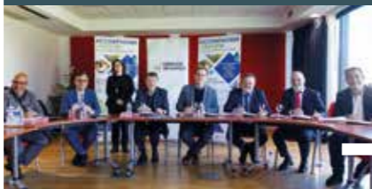
jeudi 14 décembre Saint-Loubès Signature du contrat CoNECT entre la Métropole et le Territoire Cœur Entre-deux-Mers