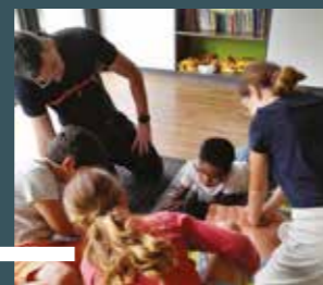
lundi 31 juillet ALSH Saint-Caprais de Bordeaux Journée de sensibilisation aux gestes de premiers secours