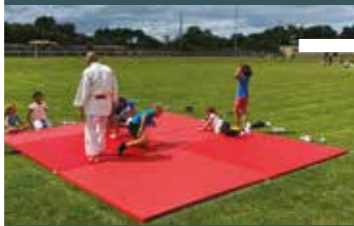
mercredi 5 juillet Camblanes et Meynac Fête des écoles