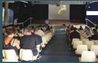
jeudi 29 et vendredi 30 juin Latresne Journées professionnelles de la jeunesse